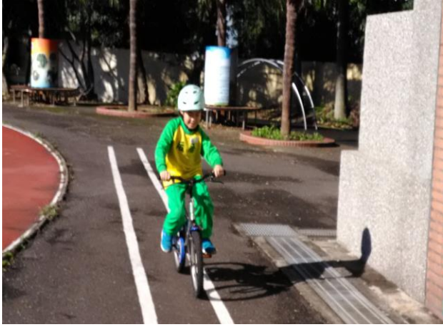
二年級單車練習-除去輔助輪