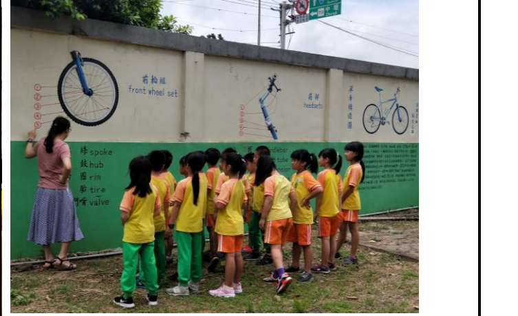
二年級自行車構造認識