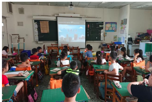
一年級認識交通工具課程