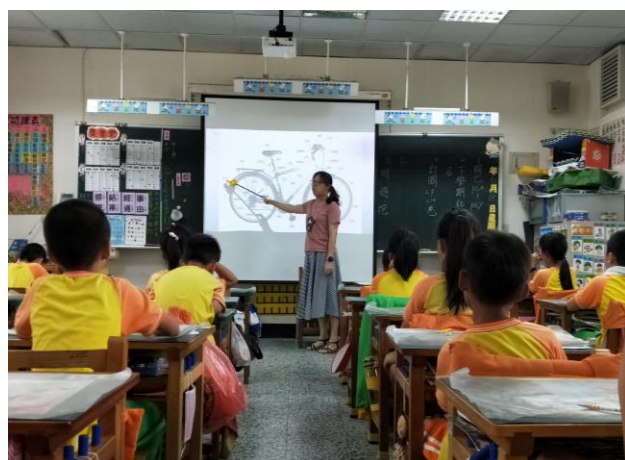
二年級自行車構造認識