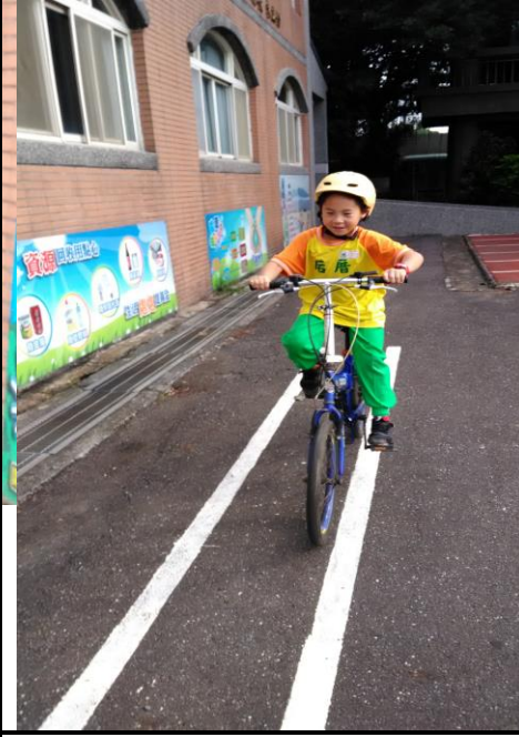
二年級單車練習-除去輔助輪(約有 1 人無法勝任)