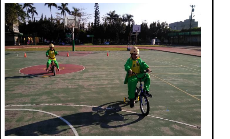
一年級使用輔助輪腳踏車練習