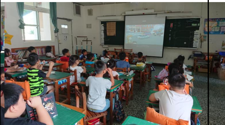
一年級認識交通工具課程