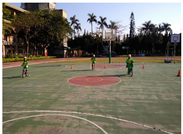
一年級使用輔助輪腳踏車練習