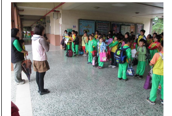
下雨天時，於穿堂集合放學