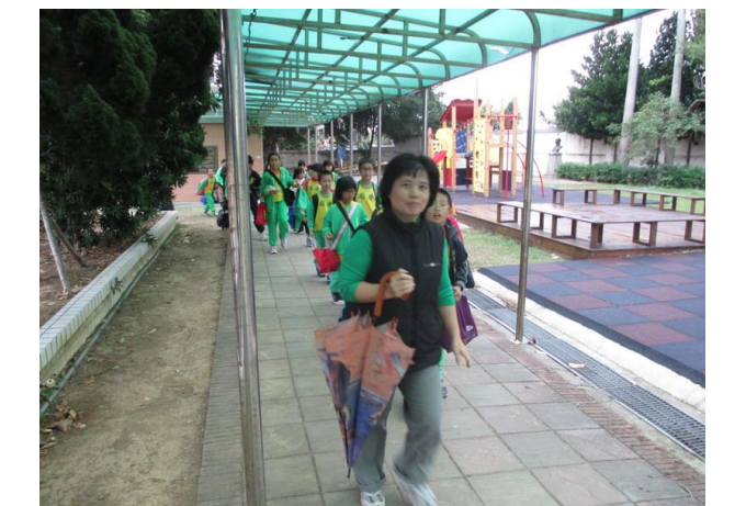
校內設置雨天專用通學步道，讓學生安全放學