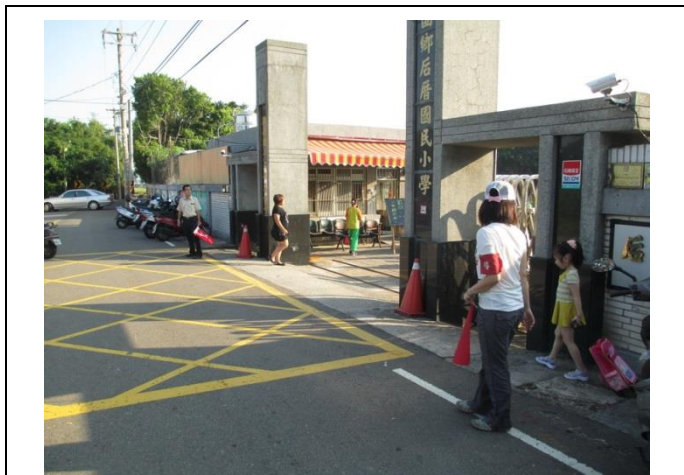
校門口外設置通學步道，讓學生平安上放學