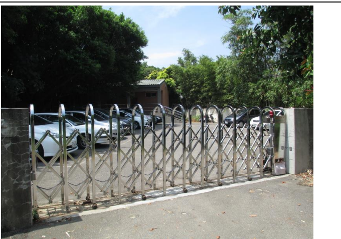
後門只開放教職員工進出，平時關閉