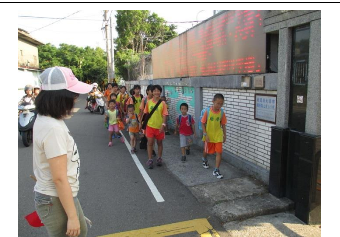
校門口外設置通學步道，讓學生平安上放學